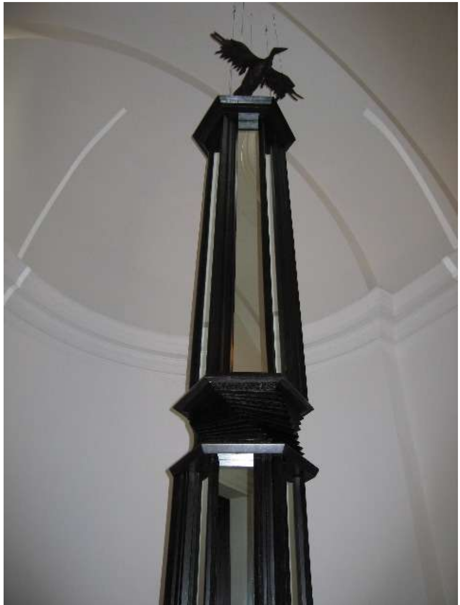
Installationview Twist Vitrene, 2007 Approx 5,7m high

1995 Judges' prize, Sasol New Signatures Competition