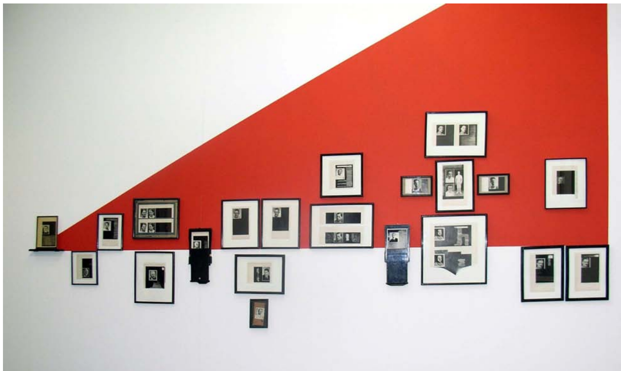
Re-Portraits 2007 Installationview Art Forum Berlin 2007 Galerie Jette Rudolph, Berlin