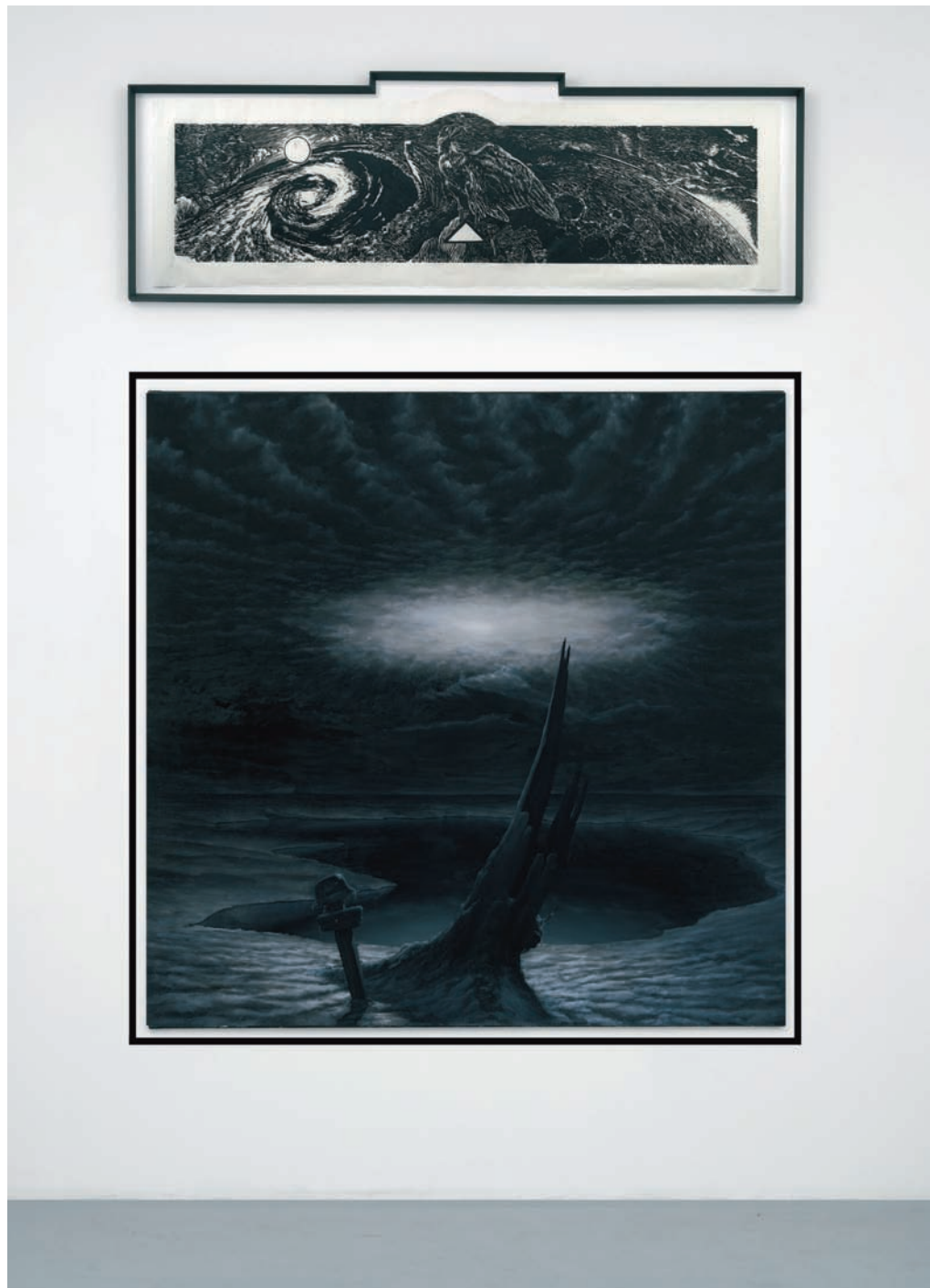
Installationview Am Einsmeer - Sommer, 2007, Oil, Sepia on canvas, 185 x 185 cm Morgenröthe, 2007, Linolprint on Rice-paper, 40 x 180 cm, Ed. 3

Sept. 2004 Absolvent an der Universität der Künste, Berlin (Klasse Wolfgang Petrick)