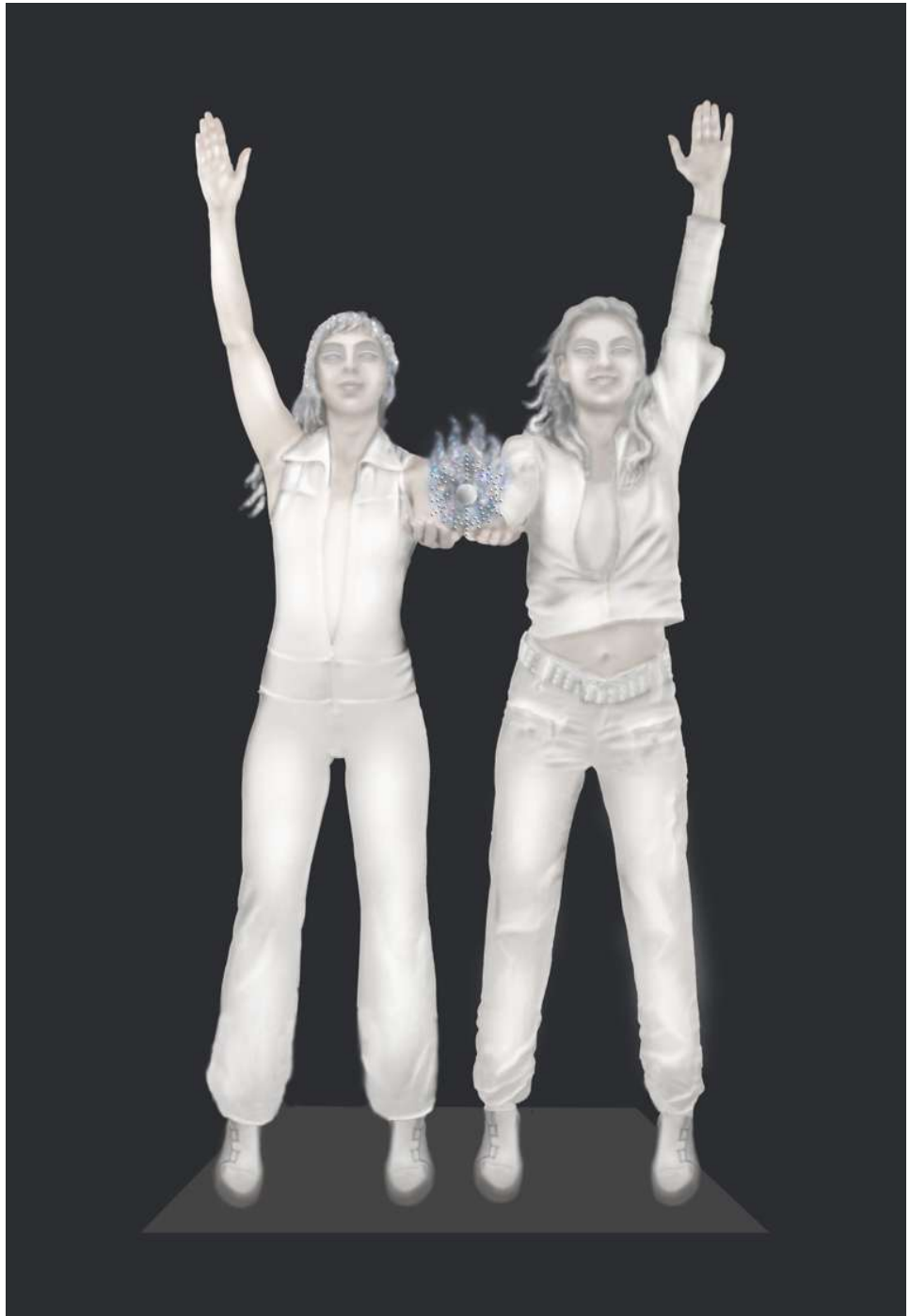
sketch for polonium advertizing sculpture, 2007

1993-1995 Studied at the New Academy of Fine Arts, St. Petersburg 1995-2000 Master and Prize of the President, University of Fine Arts, (Prof. Georg Baselitz class), Berlin 2000-2005 Lecturer at The German Film School, Berlin